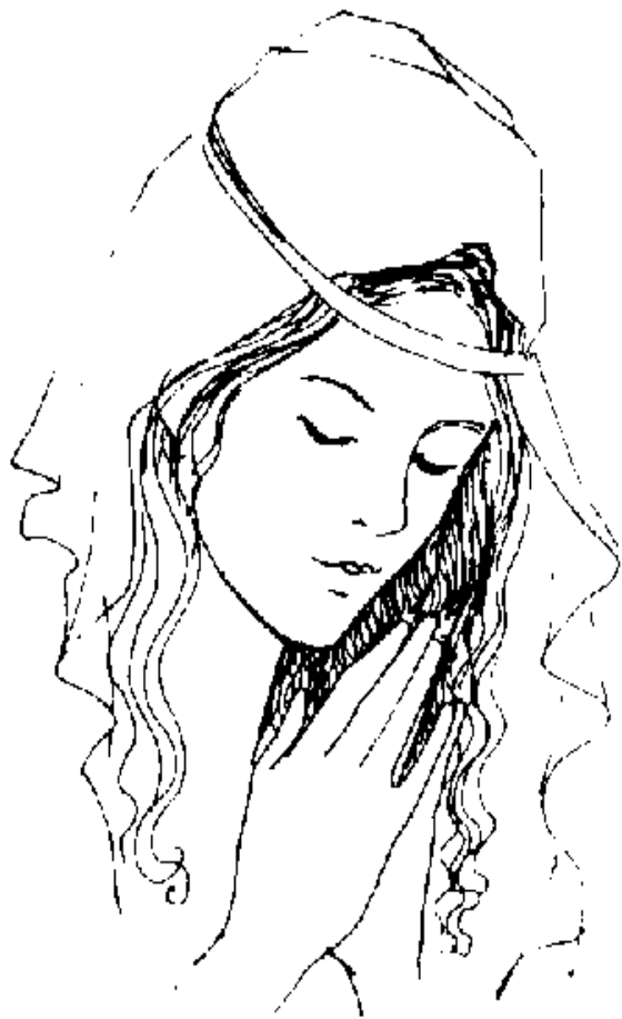
Maria ensenya'ns a pregar